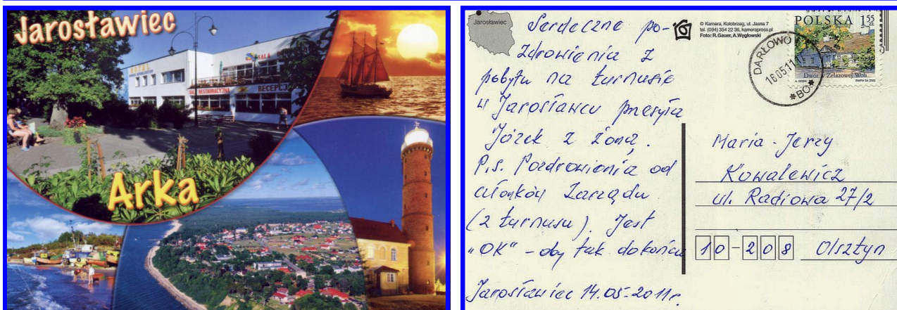
Kartka z pozdrowieniami od członków Koła SEiRP w Iławie, „wczasujących” w Jarosławcu, nad Bałtykiem.